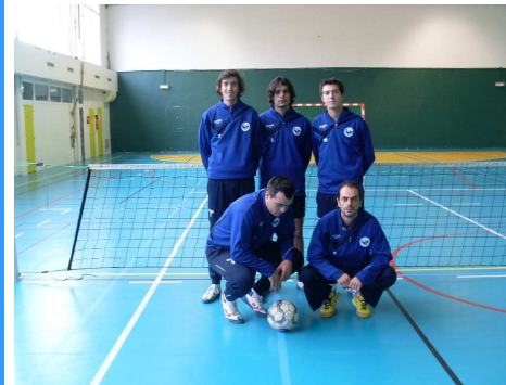
L'équipe lors de notre dernier déplacement à Suresnes.