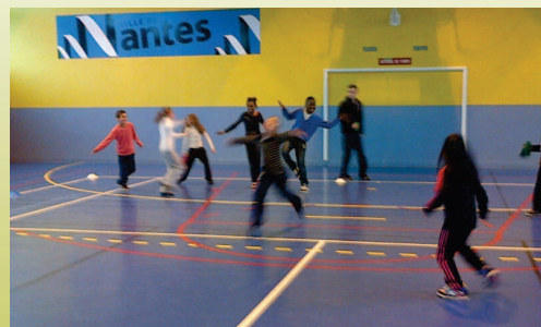
atps (Aménagement du temps péri-scolaire)

... La Grèce prend la présidence de l'Union Européenne.