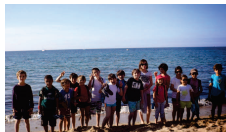
2014, centre de loisirs - île d'Yeu

De l'Éveil des premiers pas, qui accueille les bambins et leurs parents dès la marche..., à l'accueil de loisirs pendant les vacances..., en passant par les séances familles pour encourager les parents à venir pratiquer avec leur enfant. La " Lætitia " tente d'offrir des activités qui s'adressent à l'ensemble des membres de chaque foyer. Une attention particulière est aussi portée aux jeunes mamans, en leur proposant un mode de garde pour leur bébé pendant une séance de sport : c'est le Fitness maman !