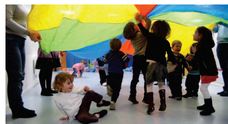
2014, éveil des petits